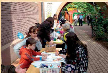
Ügyes gyerek kezek