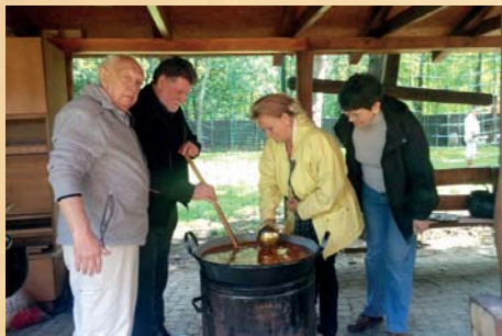
Fő a finom ebéd